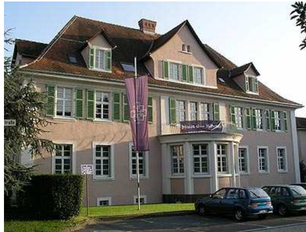
Haus der Kirche Ludwigsstraße 13 64646 Heppenheim

Das Haus der Kirche liegt zentral in Heppenheim, direkt an der B3. Parkplätze stehen vor und hinter dem Haus (Einfahrt über die Karl-Marx-Straße) zur Verfügung.